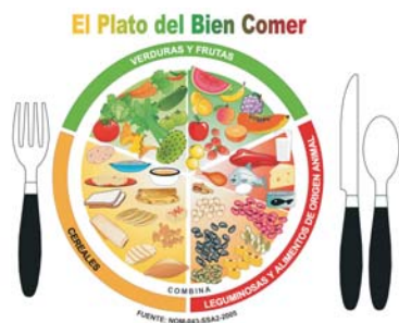
5.5 cm Versión Selección de Color

Norma Oficial Mexicana NOM-043.SSA2-2005