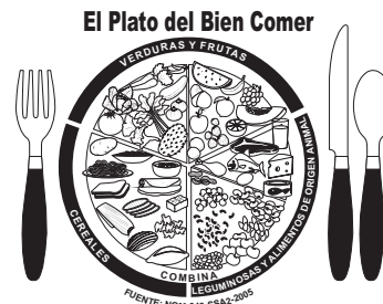
4.5 cm Versión Línea