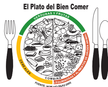
4.5 cm Versión Color Directo